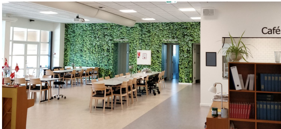
Hala centra aktivit v dánském Skjernu.