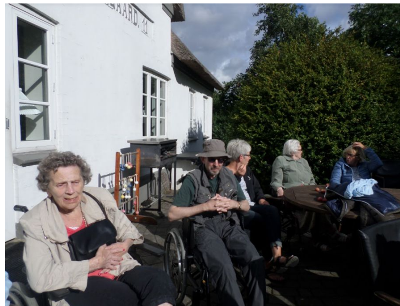
Výlety Ringkøbing Fjordparken