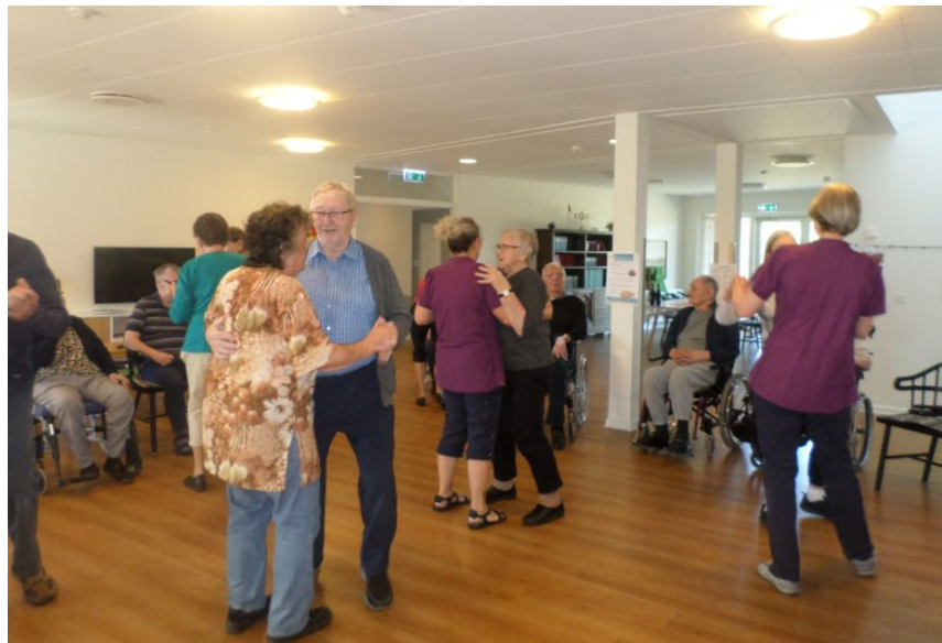
Společný tanec v rámci aktivit v Ringkøbing-Skjern regionu